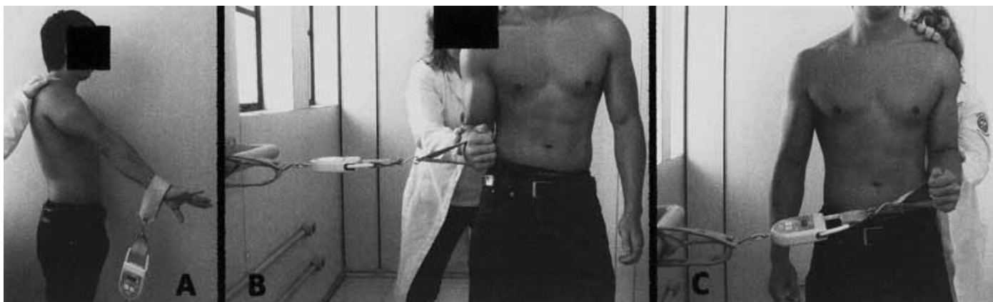
Figura 1 – Fotografias dos ombros do atleta em abdução de 90°: A) rotação lateral do ombro dominante; B) rotação lateral do ombro não dominante; C) rotação medial do ombro dominante; D) rotação medial do ombro não dominante.

No período de abril a julho de 2009 foram avaliados 55 jogadores amadores de beisebol pelo Grupo de Ombro e Cotovelo da Faculdade de Ciências Médicas